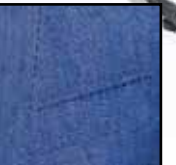
Pantolon Carnet Positano 7055 %100 Pamuk