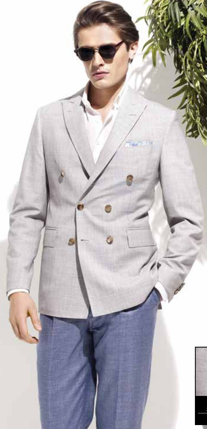
C. Clayton 35826/G7 %100 Yün