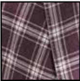
Cacciopoli Giacche 340121 Yün Kaşmir İpek