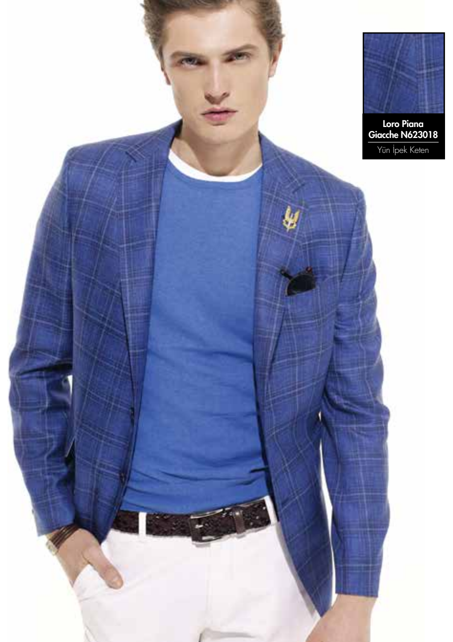
Loro Piana Giacche N623018 Yün İpek Keten

Kendini tamamen maviye teslim etmiş bir sezona girerken, gardrobunuzdaki mavileri gözden geçirmekte fayda var. Duman mavisinden safire, gök mavisinden lapise kadar mavinin hemen her tonunu bu sezon baştan aşağı giymek mümkün. Gece mavisini üzerine mürekkep tonlarındaki ekoselerden pudra mavisini üzerine lacivert çizgilere kadar birçok farklı maskülen desen mavi egemenliğinde yeniden tasarlandı. En açık gök mavisinden denim tonlarına, en iddialı mürekkep tonlarından en klasik lacivert rengine kadar mavinin her halini her tasarımda deneyimlemek mümkün.