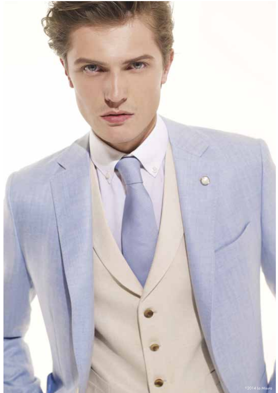
Loro Piana Giacche N621018 Kashmir İpek