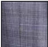
Loro Piana Giacche N623016 Yün İpek Keten