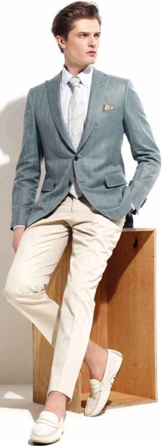
Loro Piana Giacche N623007 Yün İpek Keten